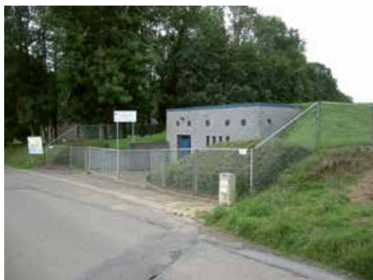
Ici le réservoir/surpresseur de la Croix-Claire construit en 1994

Sur son trajet vers le robinet des abonnés, cette eau peut être amenée à transiter dans des réservoirs tampons à partir desquels elle est relancée via des pompes pour alimenter les abonnés situés plus loin du château d'eau.