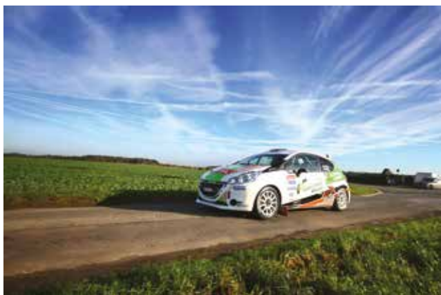
Deuxième prix : Yves Delhalle