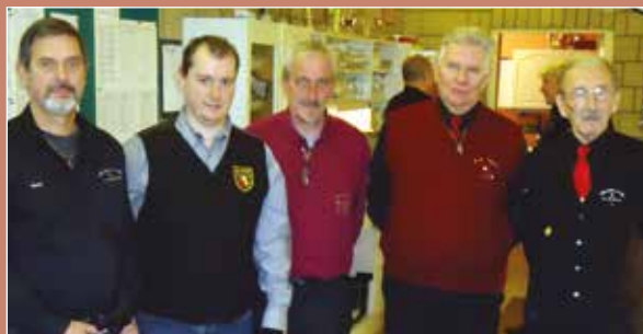
Finale 2 ème cat. (160pts) libre petit format organisée au BC St-Severin.